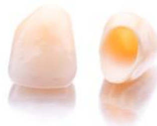
Ästhetische Kronen aus reiner Keramik

Wenn Zähne sehr stark geschädigt sind, kann man sie oft nur noch mit Kronen wiederherstellen. Wenn Zähne fehlen, können die Lücken mit Implantaten oder Brücken geschlossen werden. Klassische Kronen und Brücken haben einen Kern aus Metall, der mit Keramik überzogen ist. Und das hat einige Nachteile: