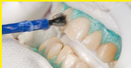
Power-Bleaching in der Zahnarztpraxis: Nachdem das Zahnfleisch zum Schutz abgedeckt wurde, wird hochkonzentriertes Bleaching-Gel auf die Zähne aufgetragen. Nach ein bis eineinhalb Stunden sind die Zähne deutlich heller.

So bezeichnet man im Englischen das schnelle Aufhellen in der Zahnarztpraxis. Dabei werden die Zähne vorab gereinigt und das Zahnfleisch mit einem speziellen Schutz abgedeckt.