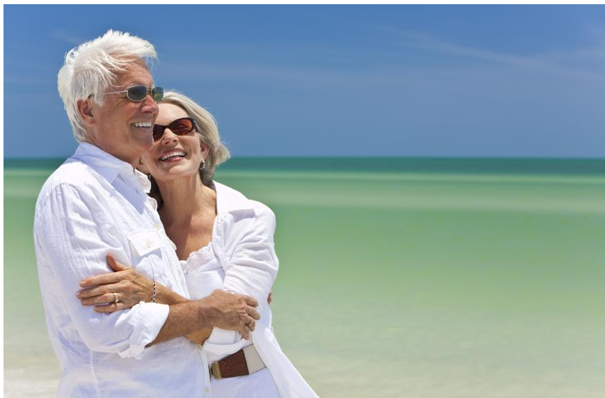
Mehr Spaß und Lebensqualität mit Zahnersatz aus reiner Keramik: Keine sichtbaren Metallteile. Kein Metallgeschmack im Mund. Gleichbleibend schöne Farben. Natürliches Aussehen.