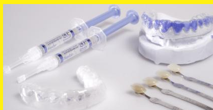
Home-Bleaching-Set: Bleaching-Gel (links oben) und Trägerfolie (links unten), die mit dem Bleaching-Gel über die Zähne gestülpt wird. Rechts oben das Gipsmodell, auf dem die Trägerfolie hergestellt wurde.

Beim Home-Bleaching hellen Sie Ihre Zähne zu Hause auf. Die dafür notwendigen Hilfsmittel erhalten Sie vom Zahnarzt. Er kontrolliert vorab, ob Ihre Zähne für das Bleichen geeignet sind und lässt