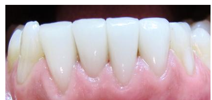
Veneers der unteren vier Schneidezähne (vor 4 Jahren eingesetzt): Das Zahnfleisch ist hell rosa und absolut gesund. Keine Verfärbung der Veneers.

Obwohl Veneers so grazil sind, halten sie sehr lange: Nach unserer Erfahrung 15 Jahre und länger! Veneers sind nicht nur für die Zähne schonend, sondern auch für das Zahnfleisch: Sie laufen zum Zahnfleischrand hin ganz dünn aus und reizen es daher nicht. Man sieht auch keinen Übergang vom Veneer zum Zahn.