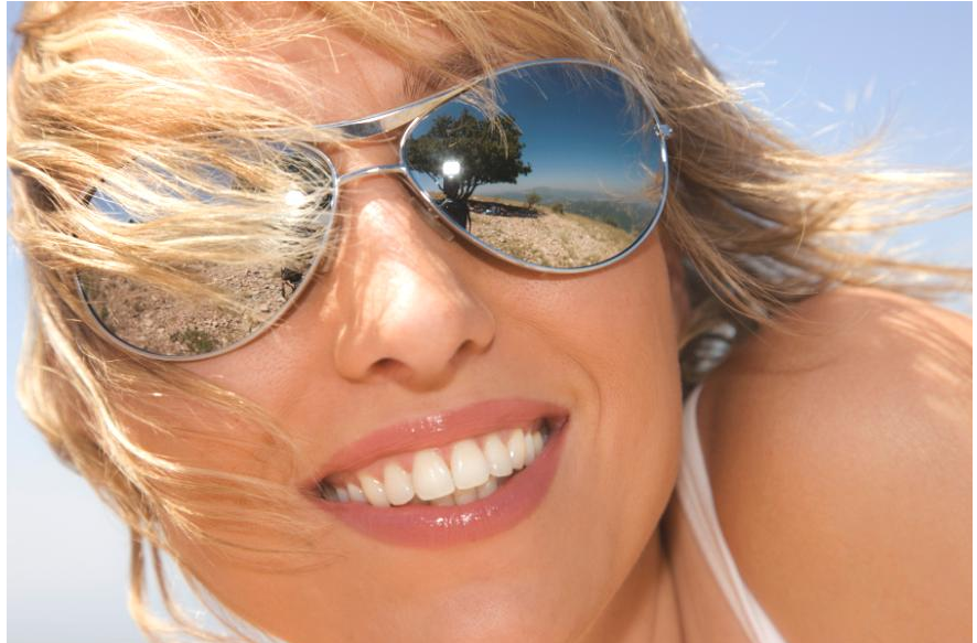
Wenn man schöne weiße Zähne hat, kann man unbefangen reden und lachen. Es macht Spaß, solche Zähne zu zeigen!

Daneben gibt es Fälle, in denen Zähne durch Fluorid-Überdosierungen fleckig werden (die sog. Fluorose ).