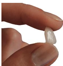
Veneer: Hauchdünne Schale aus Keramik

In allen diesen Fällen können mit Veneers ästhetische und ansprechende neue Zähne gestaltet werden. Wenn Sie Wert auf natürlich schön aussehende Zähne legen, die lange halten, sich nicht verfärben und die Ihre Zähne und Ihr Zahnfleisch schonen, sind Veneers die richtige Lösung für Sie!