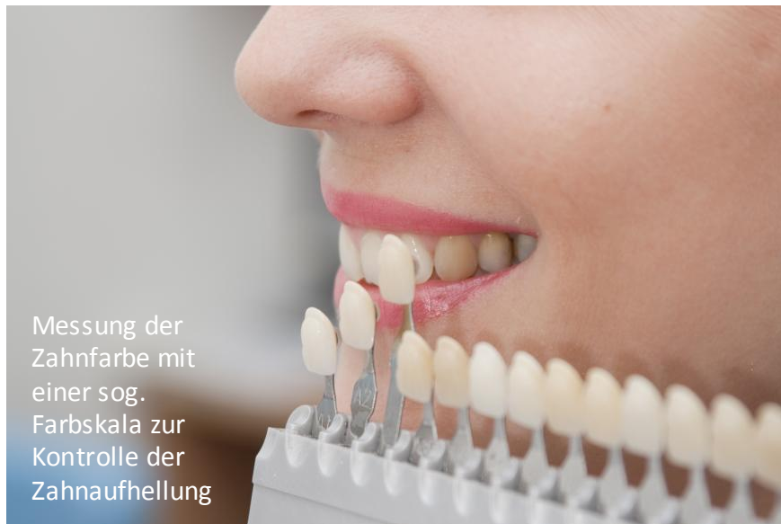
Messung der Zahnfarbe mit einer sog. Farbskala zur Kontrolle der Zahnaufhellung

Wer seine Zähne aufhellen lassen will, steht vor der Wahl: Selber machen mit Mitteln aus dem Internet oder aus dem Drogeriemarkt? Oder doch lieber vom Zahnarzt, weil man sich da besser aufgehoben fühlt?