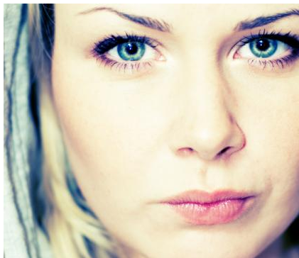
Was kann man machen, wenn nur ein einzelner Zahn auffällig dunkel ist?

Der Zahnarzt öffnet den Zahn von der Innenseite her und füllt das Bleichmittel ein. Die Öffnung ist also von vorne nicht