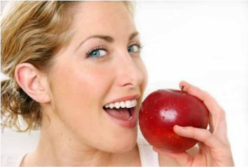
Der Apfel-Test: Blutet Ihr Zahnfleisch beim Hineinbeißen oder nicht? Blutendes Zahnfleisch ist immer ein Warnsignal! Es ist entzündet; vielleicht besteht schon eine Parodontose. Warum müssen entzündetes Zahnfleisch und Parodontose behandelt werden?

Wird leider oft auf die leichte Schulter genommen: