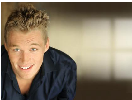
Zähne können jederzeit einfach und schnell wieder nachgehellt werden.

Ist das Nachdunkeln ein Problem? Eigentlich nicht! Die Zähne können jederzeit wieder nachgehellt werden. Das geht viel schneller als bei der ersten Aufhellung und ist preisgünstiger.